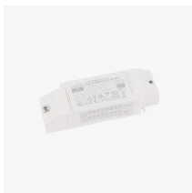
Driver DALI & PUSH 150-1050mA 8-42W 220-240V Ref. 4.1069.6102