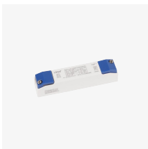
Driver ON-OFF 500mA 2,5-5W 200-240V Ref. 4.1032.1103